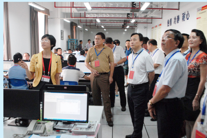
福建省人大代表视察指导招生录取工作

2015年福建省普通高校招生录取工作于7月1日开始、8月22日顺利结束。今年是教育部确定的“高考改革落实年”和“招生秩序规范年”，在省招委会主任、副省长李红的直接领导下，福建省教育考试院严格贯彻教育部和省招委会的政策规定和纪律要求，规范招生管理，加大信息公开，优化考生服务，逐步形成了规范化、程序化、公开化的招生录取机制，录取过程平稳顺利，圆满完成各批次、各科类的录取任务，实现了公平招生、阳光招生的目标，得到了考生、家长和招生院校的认可，社会反映良好，省领导给予充分肯定。招生录取期间，省人大、省政协领导分别到录取现场视察，也充分肯定了今年的高招录取工作。